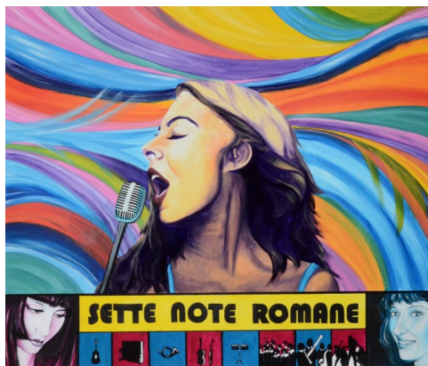
dipinto di Elettra Porfiri

22. Per ogni controversia sarà competente il Foro di Roma.