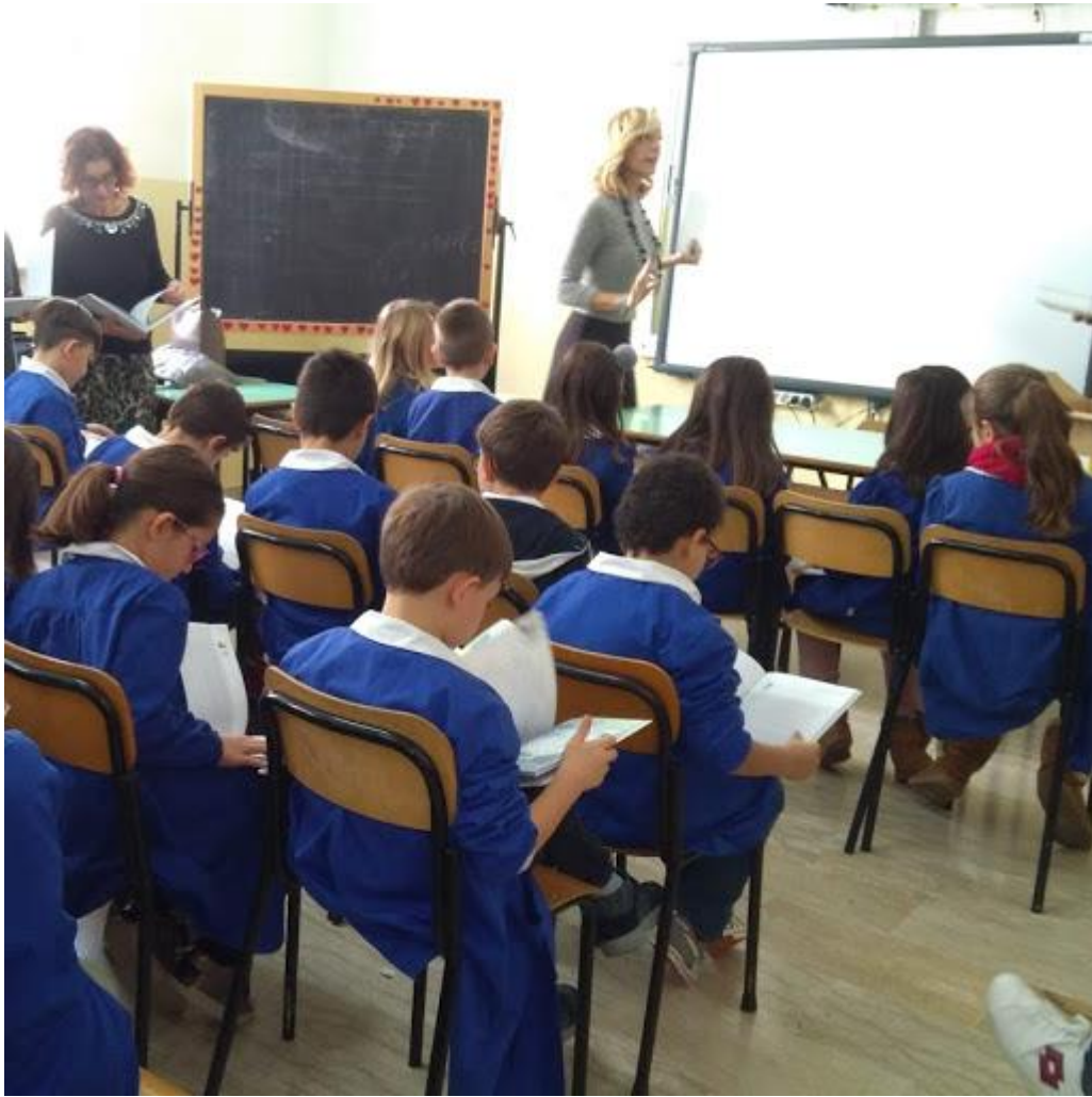
Un dono molto gradito ai piccoli lettori.