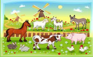
ANIMALI DI FATTORIA