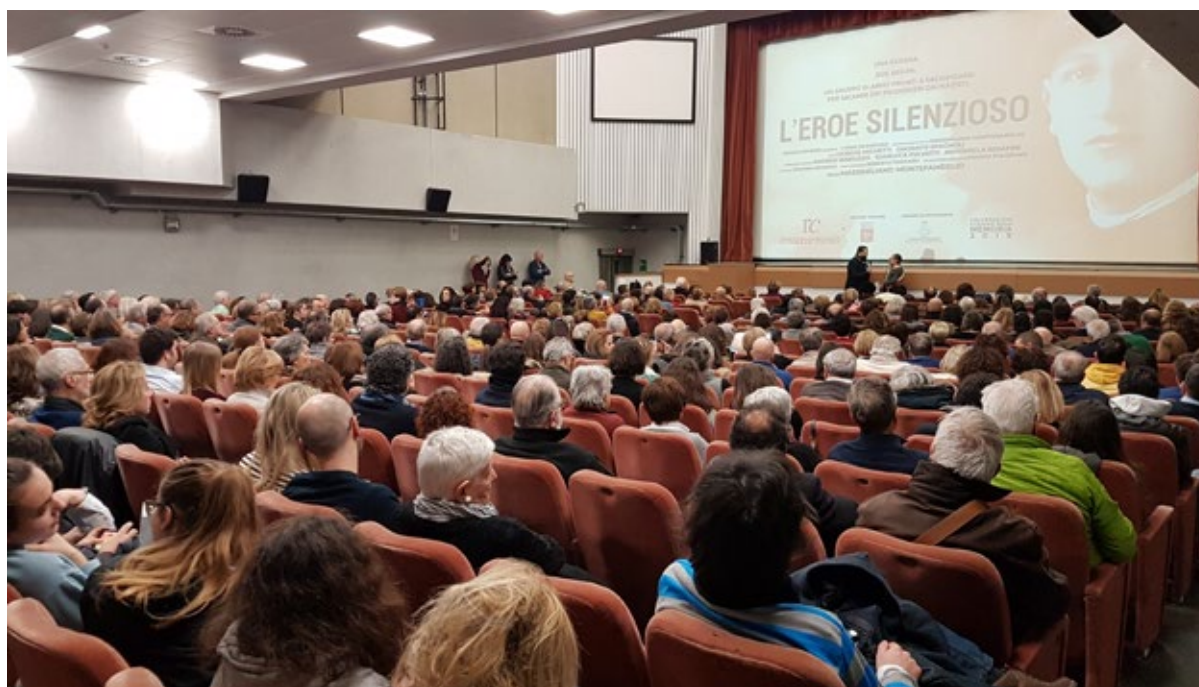
IL PUBBLICO DEL CINEMA COMUNALE DI PIETRASANTA, IN TOSCANA, DURANTE L'ANTEPRIMA DEL DOCUMENTARIO

Il documentario, infatti, vuole essere un mezzo per far scoprire un importante gesto di resistenza civile consegnandone alle nuove generazioni il senso profondo che ne deriva, e rappresenta un'occasione per conoscere la drammatica storia degli IMI, gli Internati Militari Italiani, le cui vicende sono spesso lasciate in disparte pur rappresentando un importante capitolo della storia italiana.