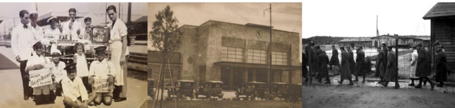
SOTTO, DA SINISTRA. LO STAFF DEL BUFFET DI SPAGNOLI, LA STAZIONE FERROVIARIA DI VIAREGGIO E ALCUNI IMI IN UNO SCATTO DEL FONDO VIALI