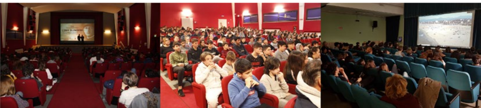
ALCUNE PROIEZIONI PUBBLICHE E PER LE SCUOLE