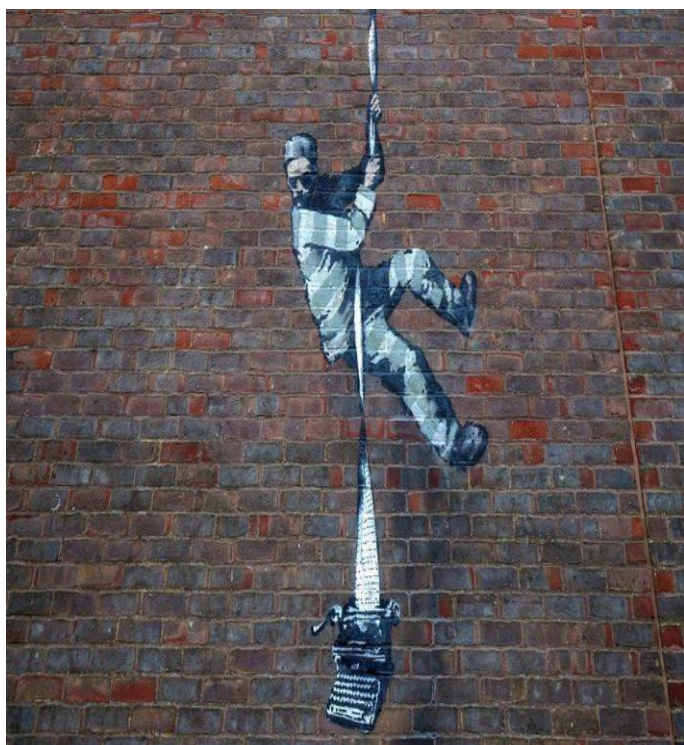
Banksy, The Create Escape , 2 marzo 2021,