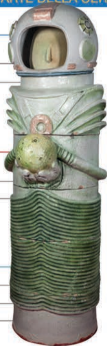
Presepe Monumentale, L'Astronauta